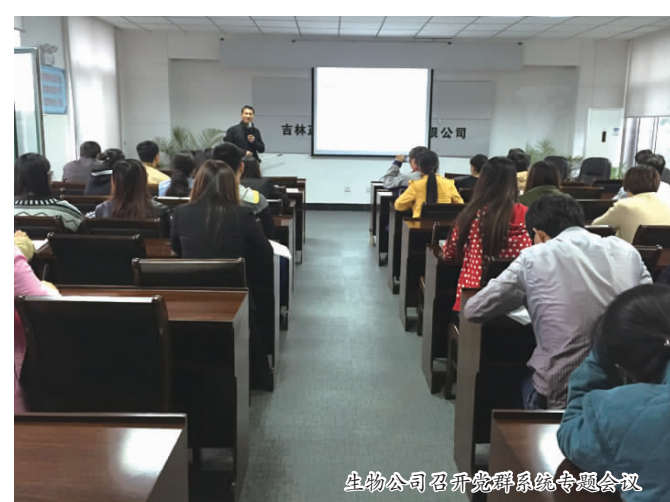
生物公司召开全体中层及技术人员以上干部专题会议

二是必须充分认清当前的严峻形势,了解企业所面临的困难,用全新的理念来审视和规划未来,面对企业内外部经营环境,既要克服畏难情绪,又要克服本位主义思想,要根据新形势新变化,潜心研究对策,有针对性的拿出应对方案,从而使企业摆脱困境,走出低谷。