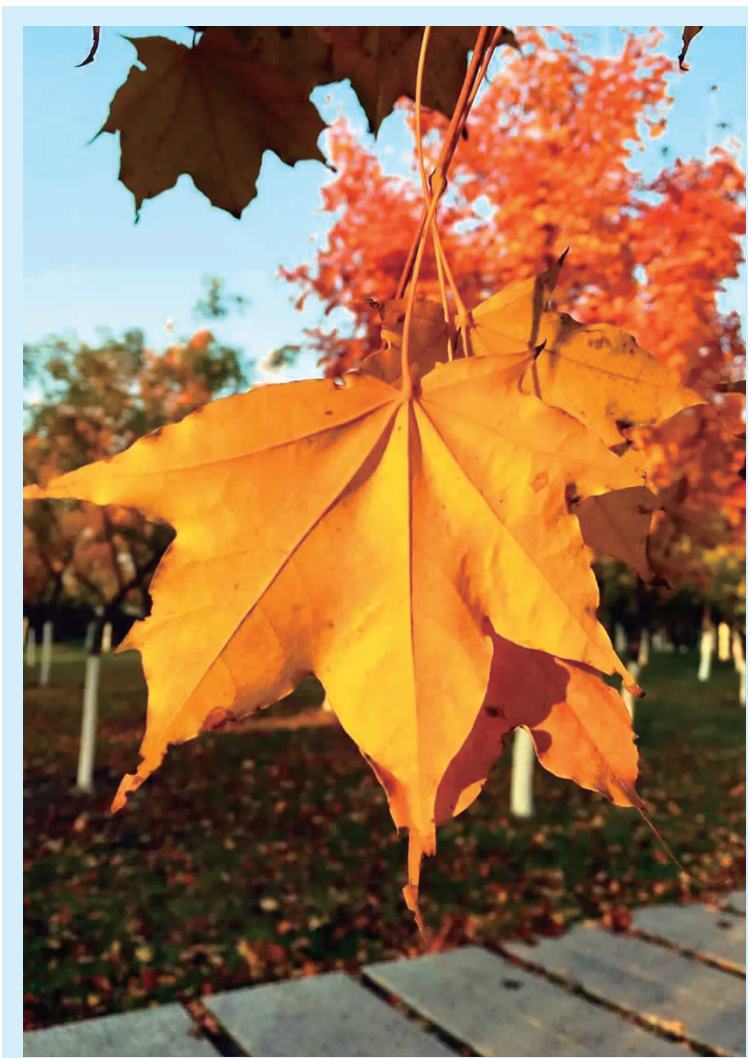
摄影作品:一叶知秋 (地产公司 谭东梅)